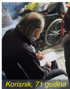
Korisnik, 71 godina

Otkako sam počeo učestvovati u akcijama podjele paketa za Udrugu, upoznao sam sigurno preko 200 starijih osoba u potrebi. Najveći utisak na mene ostavile su one koje staju same po selima, daleko od ljudi i mogućnosti da im neko pomogne. Teško nas puste da odemo kući, nedostaje im društvo. Najtužnije je kad kažu: "Dođite još koji put dok smo živi." Sretan sam što mogu donijeti bar malo radosti u njihov život. Volonter koji najviše putuje (od 2021.)