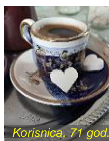
Korisnica, 71 god.