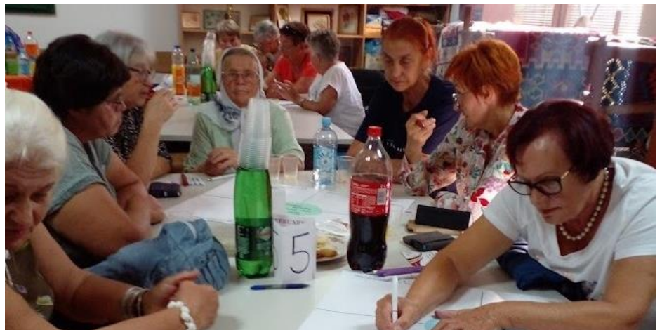
U World Cafe evaluaciji diskutira 40 starijih sudionika/ca projekta o njihovim resursima za participaciju u razvoju solidarnog društva koje uključuje i stariju generaciju.