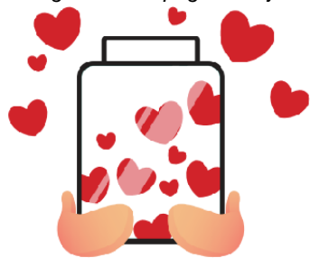
Logo der Kampagne in Ilijas

Und unzählige Stunden, die die alten Tage mit Lebensfreude erfüllten.