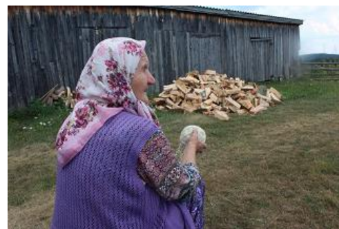
2 m 2 Holz kosten die Hälfte der monatl. Rente. Die Busse fürs Selbersammeln ist sehr hoch.