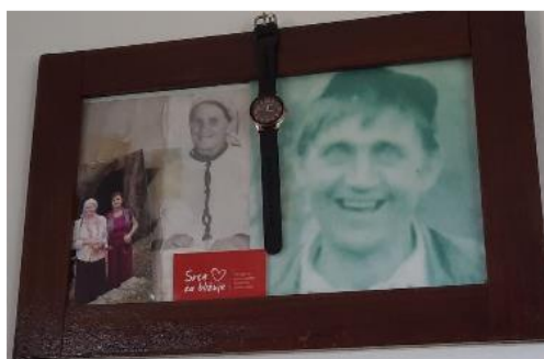
Unsere Visitenkarte ist der einzige Kontakt, den eine betagte Frau in der Not nutzen würde.